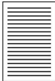
Magic Compatto – Disposición lámparas