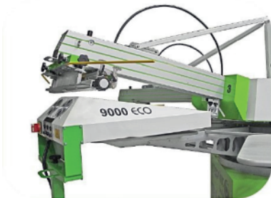
Cappa per essiccazione intermedia