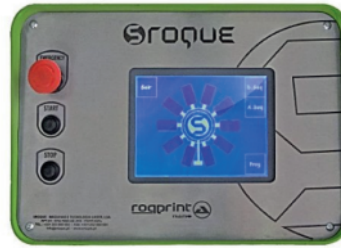
Display LCD touchscreen