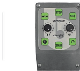
Pannello controllo testa di stampa