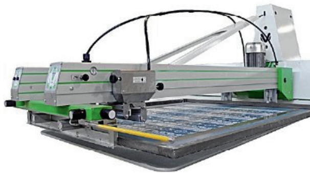
Doppia testa di stampa