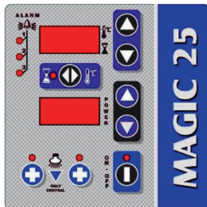
Tastiera di comando Magic 25