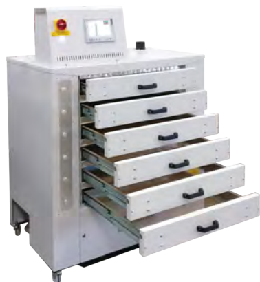
Dido Pro con 6 cassetti