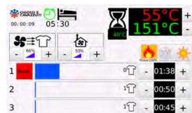
Dido Shop Interfaccia di lavoro