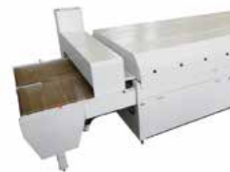
Cappa di aspirazione ed estrattore fumi esausti

Sono disponibili altri modelli e configurazioni su richiesta