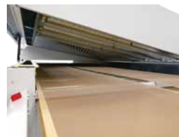
Apertura superiore elettroattuata con modulo opzionale a Infrarossi

Larghezza Nastro: 1400 - 1750 - 2x800 mm