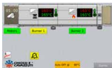
Griff Interfaccia PLC