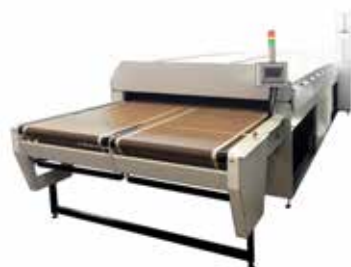
Configurazione a due nastri affiancati